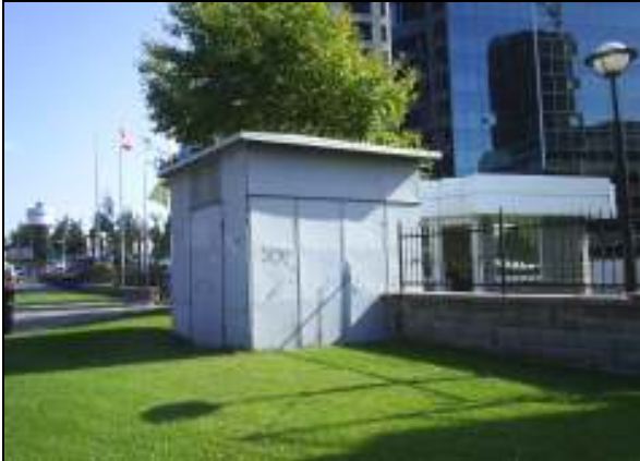
LEVENT TRAFİKO- ESKİ HAL