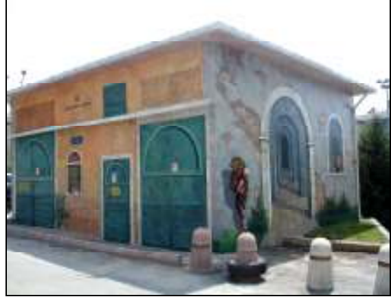
MERTER TRAFİKO- YENİ HAL