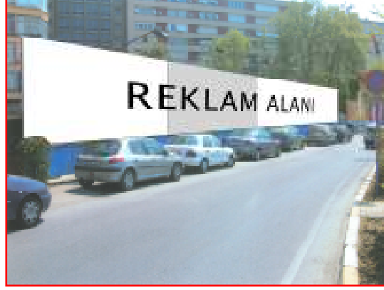
Paravan Yüzey İçin