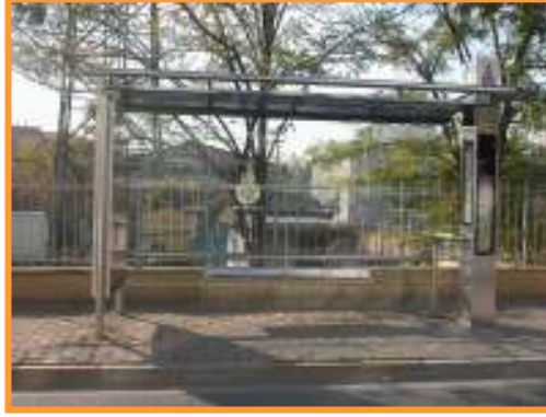
İETT DURKLARININ YENİ HALİ