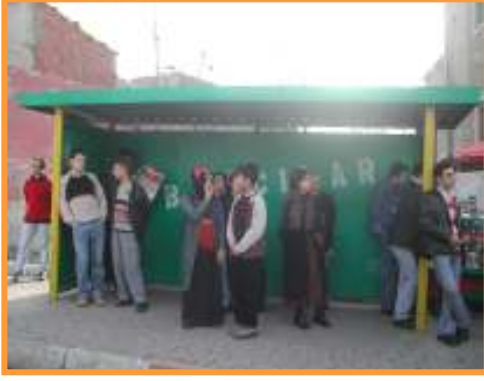
İETT DURKLARININ ESKİ HALİ