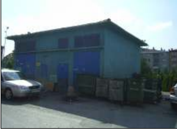
MERTER TRAFİKO- EKSİ HAL