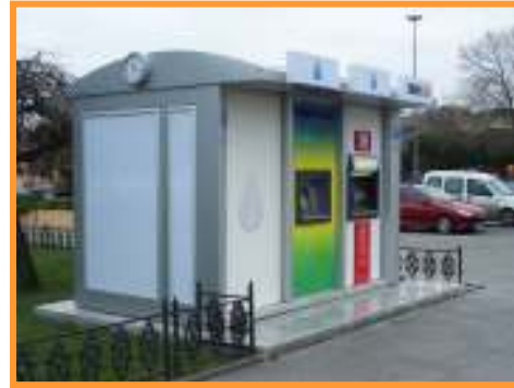
İBB SARAÇHANE BİNASI ÖNÜ