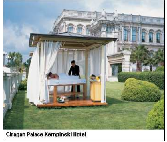
Çırağan Palace Kempinski Hotel

Amerikan spa mag isimli internet portalı, 16 Nisan 2010 tarihli haberinde Global Spa Zirvesi'nin (GSS) 16-19 Mayıs 2010 tarihleri arasında İstanbul Çırağan Kempinski Otel'de yapılacağını duyurdu. Haberde, zirvenin düzenlenmesi için seçilen mekanın 2010 zirvesinin "inşa edilmeye değer köprüler" temasıyla spalar, sağlık, tıp, turizm, fitness ve güzellik arasındaki bağları güçlendirme amacına uygun olduğu ifade edildi.