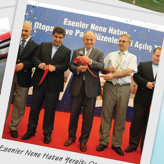
Esenler Nene Hatun Yeraltı Otoparkı