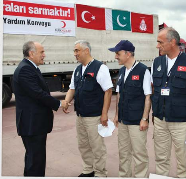
İstanbul'dan kardeş Pakistan'a vefa...