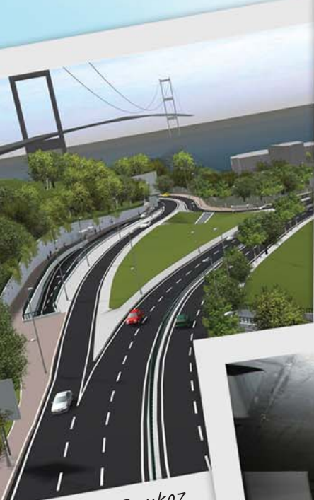
Üsküdar - Beykoz trafiğini rahatlatacak proje

bu bülten sizindir alabilirsiniz- www.ibb.gov.tr • eylül 2010