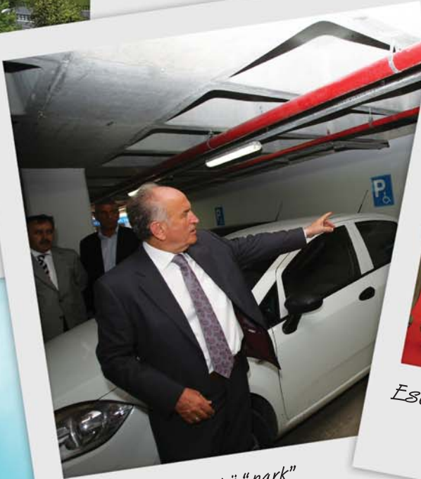
Altı "otopark" üstü "park"