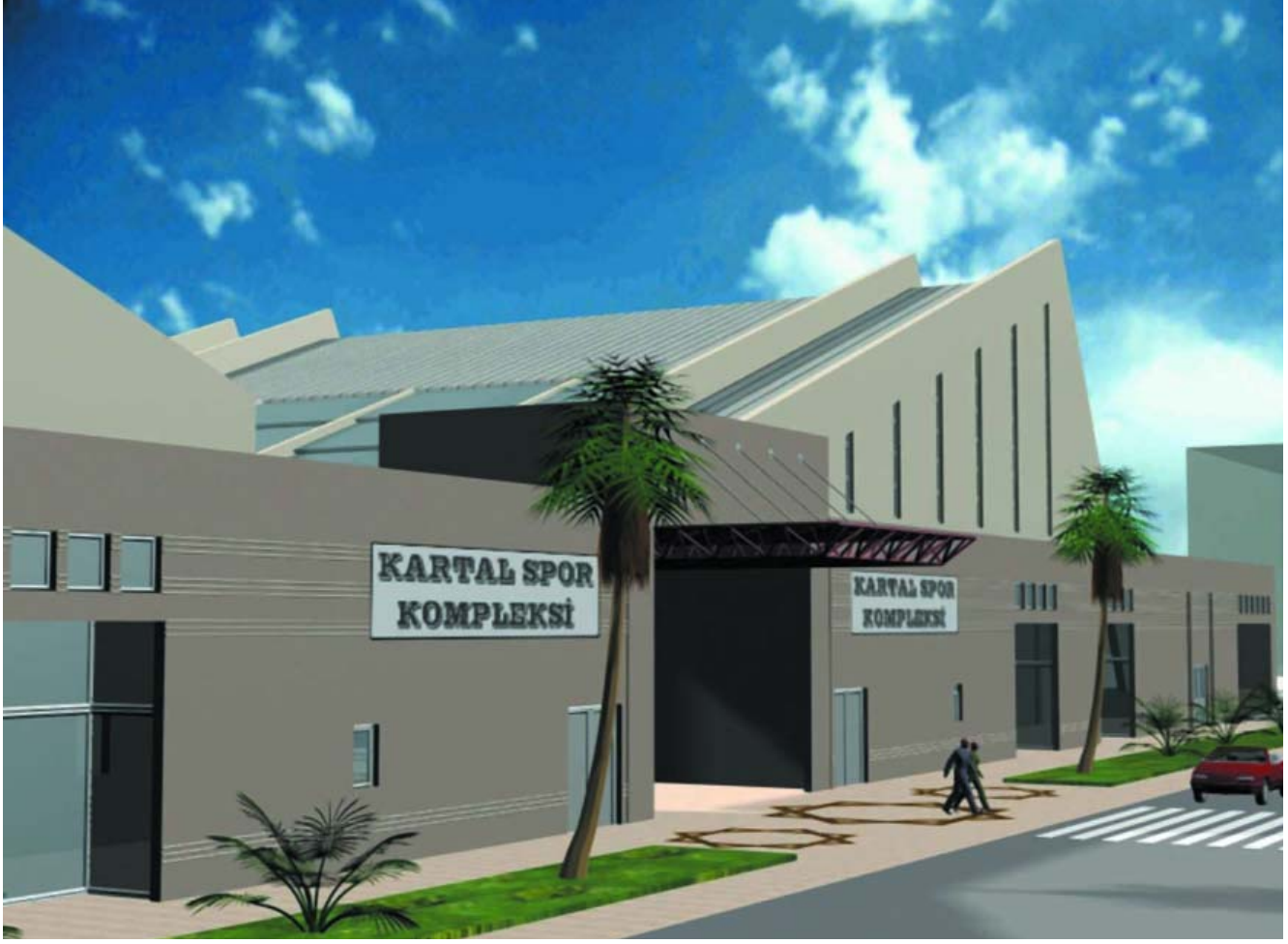
Kartal Spor Kompleksi Projesi

lanmış olup, 5 bodrum kat + zemin kat + 1.kat ve ara katdan oluşmaktadır. İki bloğun toplam oturma alanı 7793 m 2 dir. 2.3.4.5. bodrum katlar otoparklara ayrılmıştır. Zemin katta basketbol sahası, olimpiik yüzme havuzu ve kompleks giriş holleri, ofisler ve kafeterya vardır. 1. kat ve ara katlar tribün ve girişlerinden oluşmaktadır. Yüzme havuzunun tribünü 765 kişi, basketbol salonunun tribünü 1150 kişi kapasitelidir. Diğer spor salonları 1. bodrum kattadır. 1. bodrum katta ayrıca, havuz tesisat odası, denge tankları, havuz makine dairesi, ısıtma-soğutma merkezi, soyunma odaları, duşlar, eğitmen odaları, otomasyon merkezi, depolar ve teknik servis mevcuttur.