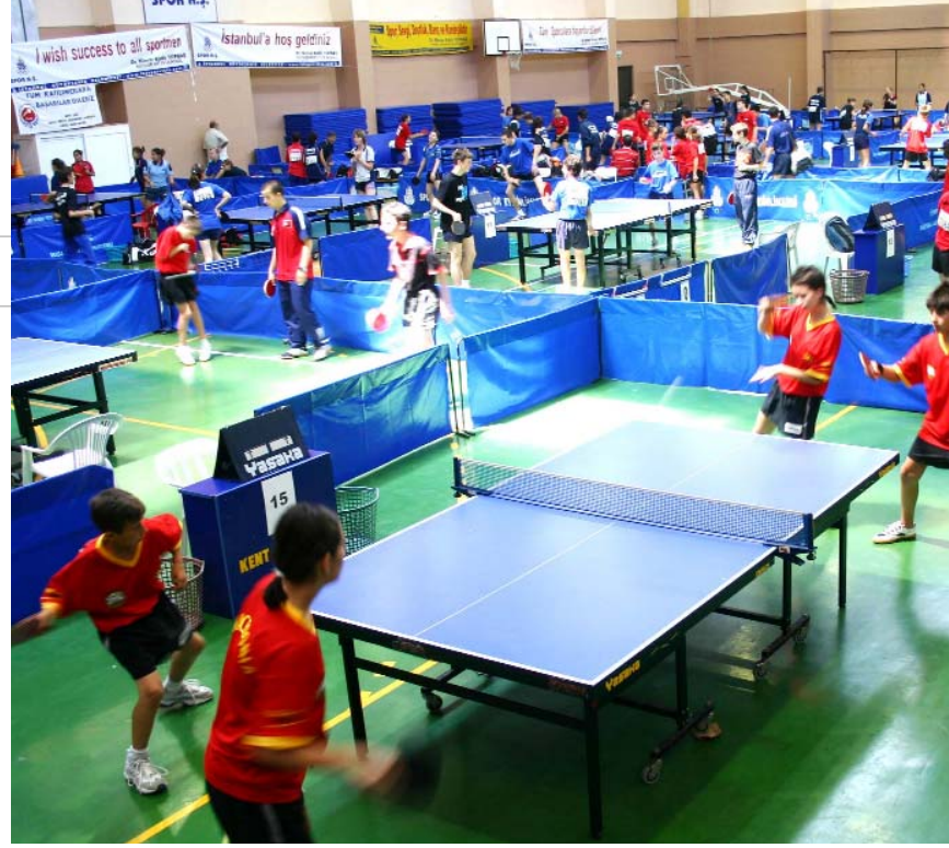
Balkan Masa Tenisi Turnuvası

Türkiye Plaj Voleybolu Şampiyonası III. Etapı 22 - 24 Temmuz tarihleri arasında Yeşilköy sahillerinde gerçekleştirildi. Erkekler ve bayanlar kategorilerinde 16'şar takımın mücadele ettiği etap sonunda Balkan Şampiyonası'nda ülkemizi temsil edecek milli takım sporcuları da belirlendi. Şampiyonada dereceye giren sporculara madalya, kupa ve çeşitli ödüller verildi.