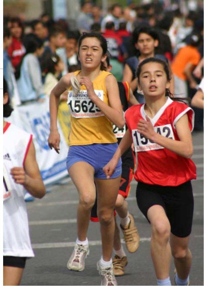
Kıtalar Arası Avrasya Maratonu

Dünyanın ünlü tenisçilerin katıldığı İstanbul Cup Tenis Turnuvası birbirinden güzel ve çekişmeli maçlara sahne olurken, İstanbul'umuz ve ülkemiz için de iyi bir tanıtım oldu. Bu turnuvayla İstanbul, dünyanın önemli ve sayılı turnuvaları arasında yerini alırken bundan sonraki