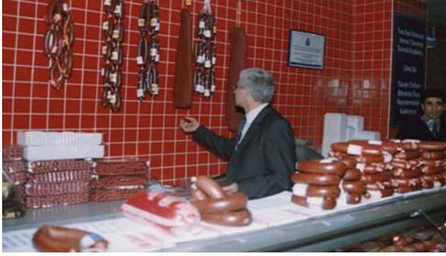
Gıda Denetim Faaliyeti