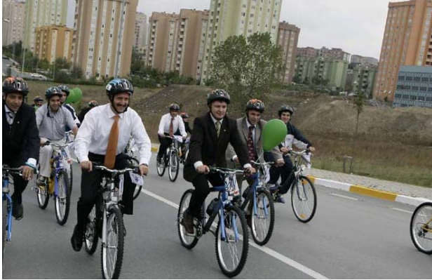
Darülaceze Müdürlüğü Kayışdağı Tesisleri

2005 yılında yürütülen diğer bir proje olan ‘Darülaceze’de Sağlıklı Yaşam Projesi’ nin uygulanması ile sakinlerimizin sağlık sorunları bir bütünlük içinde değerlendirilmiştir. “Darülaceze’de Sağlıklı Yaşam Projesi” Ocak 2005 tarihinde uygulanmaya başlandı, Aralık 2005 tarihin-