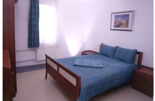
Tek Yataklı Odalar

Bütün sakinlere günde üç ana ve iki ara olmak üzere toplam beş öğün yemek verilmekte, barınma, giyim ve sağlık ihtiyaçları da müdürlük tarafından karşılanmaktadır.