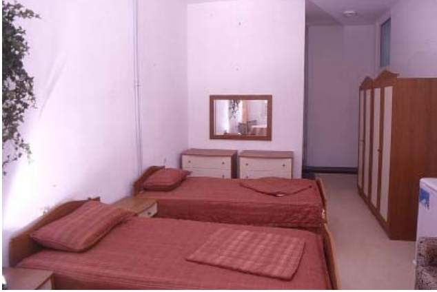
Çift Yataklı Odalar