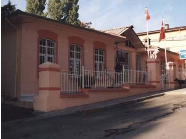
Üsküdar Hayvan Polikliniği.