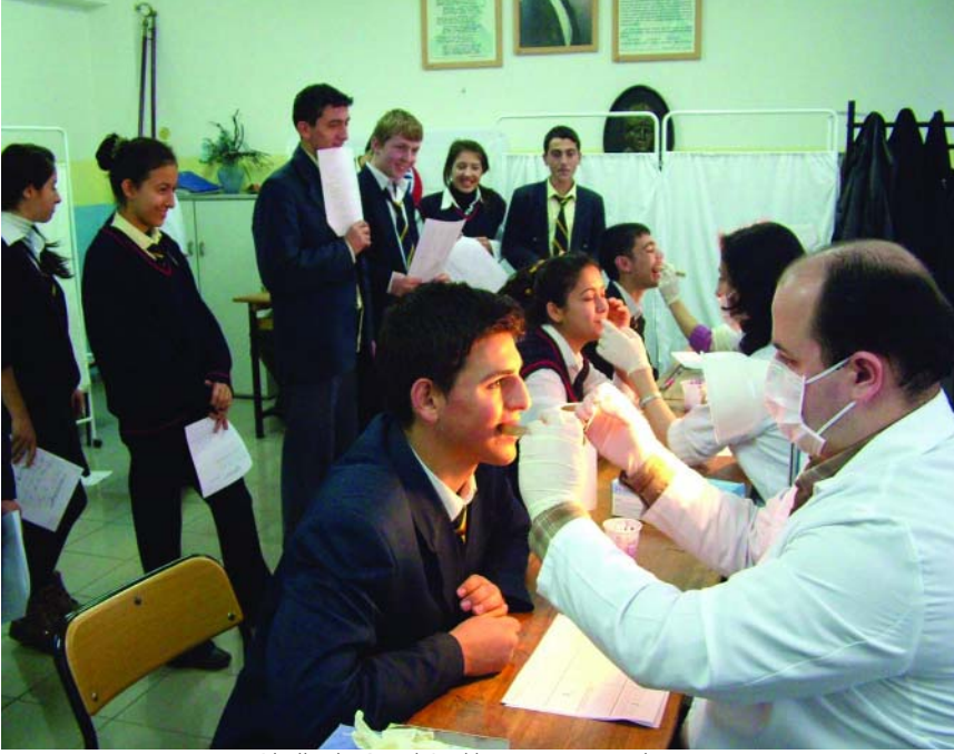
Okullarda Genel Sağlık Taraması Uygulaması

A.Ş. tarafından ortaklaşa yapılan ilk ve orta öğretim okullarında sağlık taraması hizmeti kapsamında 30.920 öğrenci sağlık taramalarından geçirilmiştir. 2005 yılı sonu itibariyle toplam 63.000 öğrenciye ulaşılmıştır.