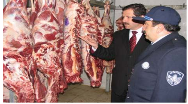
Kesik Et Denetim Faaliyeti