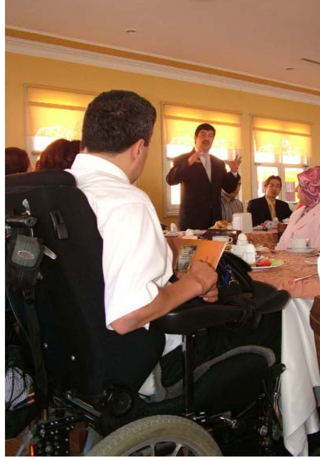
Özürlü Eğitim Merkezi (İSÖM)