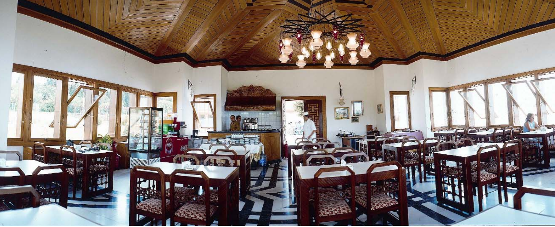
Çamlıca Köşkleri (Küçük Çamlıca)