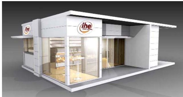
Yeni Ekmek Satış İstasyonları