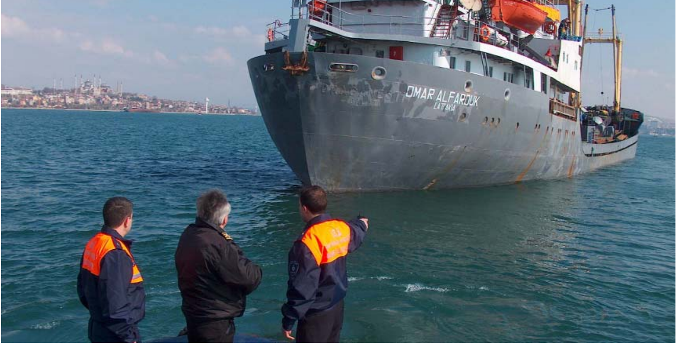
Çevre Kanununa Göre Yapılan Denetimler

temizlik ekipleri oluşturulmuştur. ÇEVRE KANUNUNA GÖRE YAPILAN İŞLEMLER 2872 Sayılı Çevre Kanuna göre, Çevre Koruma ve Kontrol Müdürlüğü Teknik Elemanları ile müştereken G.S.M. denetimleri yapılmakta ve usulsüzlüğü teknik elemanlar tarafından tespit edilenler hakkında tutanak tanzim edilmektedir. Çevre Koruma ve Kontrol Müdürlüğü uhdesine görevlendirilen Zabıta Amirliği ekiplerimiz denizde denetimler yapmakta, deniz kirliliğine sebep olan gemiler hakkında tutanak tanzim ederek, Belediye Başkanlığınca 2872 Sayılı Kanun doğrultusunda cezai işlemler uygulamaktadır. 2005 yılında Çevre Kor. Müd. Teknik elemanları ile müşterek yapılan denetimlerde, 810 iş yeri denetlenmiş, 371 tespit tutanağı, 36 işyerine tebligat yapıp süre verilmiş, ayrıca Çevre Kanununa göre yapılan gemi denetimlerinde 60 adet zabıt tanzim edilerek ilgililerine 1.255.195 YTL. Para cezası tahakkuk ettirilmiştir.