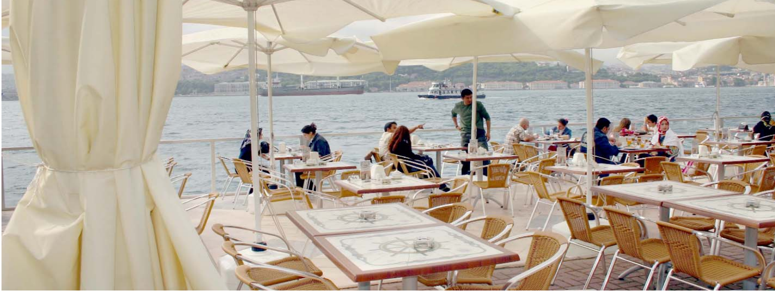
Paşa Limanı Sosyal Tesisleri

İlgili iyileştirmeler için projeler hazırlanmıştır. Alınan otoparklar hızla rehabilite edilmektedir. Devir alınan otoparklarda