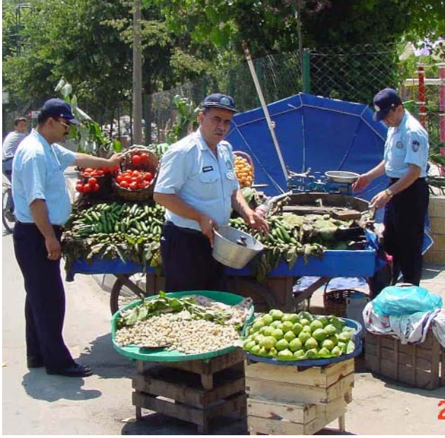
Seyyar Satıcıların Denetimi

Diğer hizmet birimlerimiz ile birlikte İstanbul genelinde toplam 24 Zabıta Amirliğimiz ile 24 saat esasına göre hizmet verilmektedir.