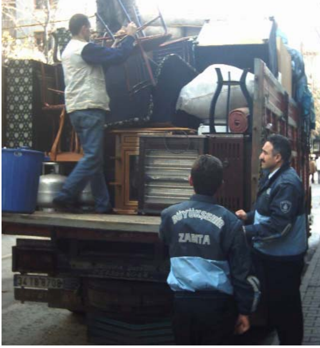
Yoksul Sevk Hizmeti