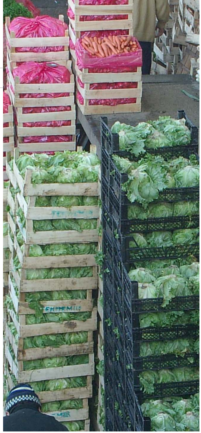
Bayrampaşa Sebze ve Meyve Hali

şaipe'ler önlenmiştir. Ayrıca Belediye açısından önemli bir gelir kaynağının, önceden belirlenen bir zamanda bütçe gelirlerine dahil edilmesi temin edilmiştir.