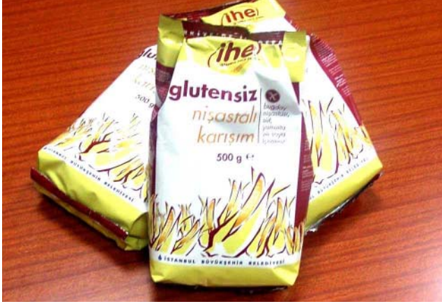
Çölyak Hastaları İçin Glutensiz Ekmek

tından 1.738 trilyon lira ödemede bulunduk.