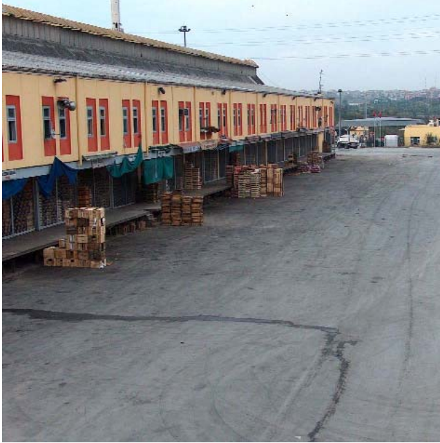
Bayrampaşa Sebze ve Meyve Hali