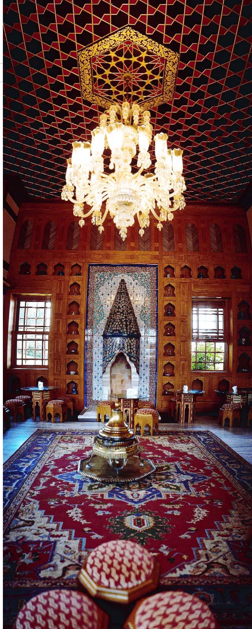
Çamlıca Köşklü (Küçük Çamlıca)