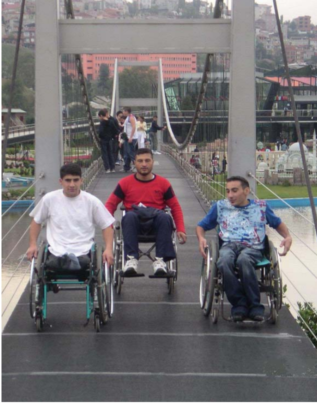
Engellilerin Miniaturk Gezisi

zin elemanları bire bir ilgilenmekte ve hastane işlemlerini takip etmektedirler. 350 kadına sağlık yardımında bulunuldu. Bunların yanı sıra doğumu yaptırılan 83 aileye çocuk maması, giysileri ve karyola verildi.