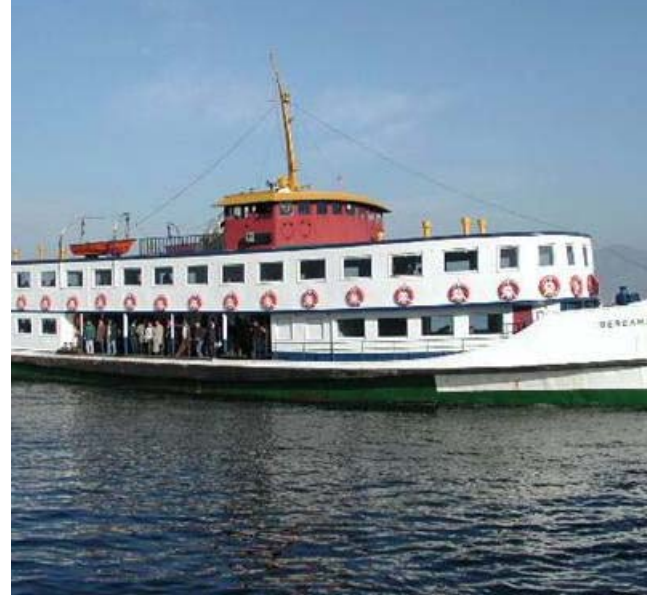
İDO Sanat Gemileri Projesi

Convention Center ve Lütü Kırdar Uluslararası Kongre ve Sergi Sarayı Rumeli Salonu alt katında düzenleniyor. Hilton Convention Center'da ürün pazarlayan firmalar; Rumeli Salonu'nda ise, tasarım, proje ve maketler ile yazılım firmaları, yayın kuruluşları gibi hizmet sektörü mensupları yer alıyor.