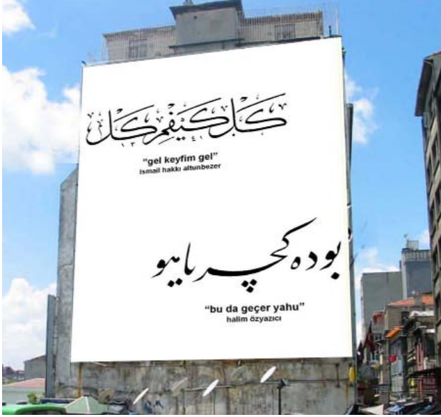
Istanbul Yaya Sergileri Projesi