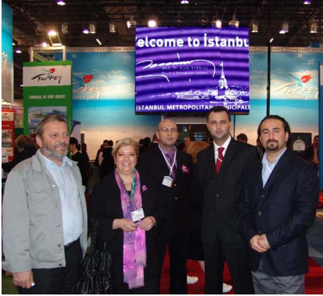
Londra Turizm Fuarı