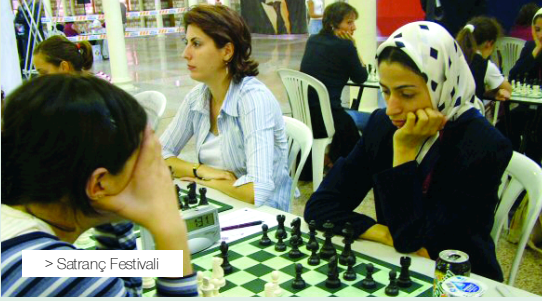
> Satranç Festivali