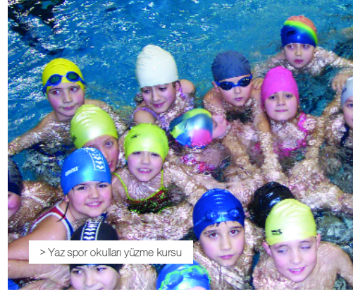
> Yaz spor okulları yüzme kursu