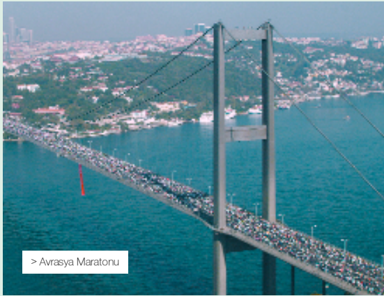
> Avrasya Maratonu

Büyükşehir Belediyesi çalışanları ile ilçe belediyeleri mensupları ve yakınlarını biraraya getirmek, kaynaştırmak ve amatör ruhla, centilmence müsabaka halinde yarıştırmak amacıyla geleneksel olarak düzenlenen Futbol Turnuvası, bu yıl 22. kez Çırpıcı Spor Tesisleri halı sahalarda yapıldı. İSKİ, İETT, Büyükşehir Belediye Birimleri ve bağlı Şirketleri ve İlçe Belediyeleri'nden 70'e yakın takımın katılımıyla gerçekleştirildi. Her yıl