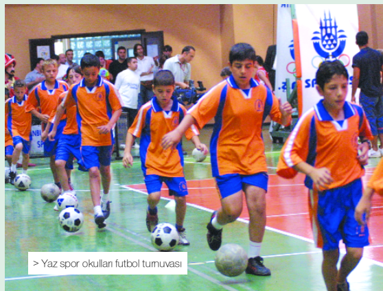
> Yaz spor okulları futbol turnuvası