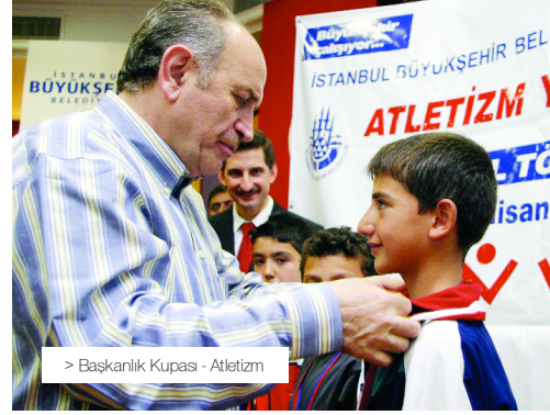
> Başkanlık Kupası - Atletizm

Büyük atılımlar gerçekleştirilmesi gereken yüzme sporuna destek vermeyi ve yeni sporcular kazanmayı hedefleyen yarışlar İstanbul genelinde büyük ilgiyle karşılanacaktır. Kültürlü ve okullu sporcuların katılacağı müsabakalar bu alanda yeni isimlerin yetişmesine de katkıda bulunacaktır.