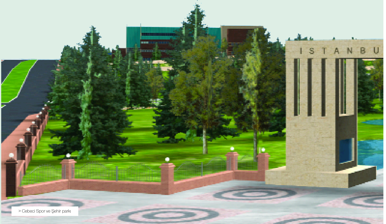
> Cebeci Spor ve Şehir parkı

İstanbul Büyükşehir Belediyesi bir yandan 15 spor merkezinde günde ortalama 30 bin İstanbullu'ya spor hizmeti sunarken, diğer yandan İstanbul'un olimpiyat adaylığı sürecini de dikkate alarak spor kültürünü toplumun her kesimine yayma doğrultusunda önemli çalışmalar yürütmektedir. Bu çerçevede 1989 yılında İstanbul Büyükşehir Belediyesi'nin sahip olduğu spor tesislerini İstanbullu'ların hizmetine sunmak, organizasyon ve etkinliklerle gençlerin sağlıklı şekilde yetişmesini sağlamak ve Türk sporuna altyapı desteği vermek amacıyla SPOR A.Ş. kuruldu. Yıllık ölçekte Spor A.Ş.'nin