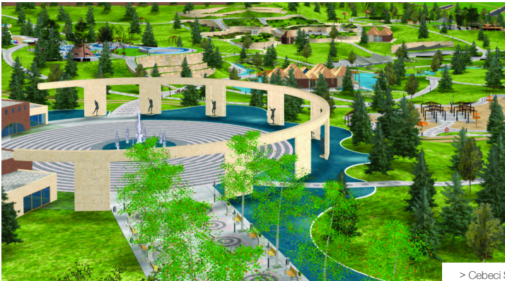
> Cebeci Spor ve Şehir parkı

Spor temalı park içerisinde bir de koşu parkuru ve bunun yanında bisiklet parkuru oluşturulmuştur 1537metre uzunluğunda olan parkur ring şeklindedir. Koşu parkuru üzerinde; kültür meydanı ile su oyun alanı arasındaki bir noktadan başlayan ve bisiklet tunuvaları için başlangıç noktası olacak küçük bir meydan düşünülmüştür. Alana gelen kişileri yeşillikler arasında do-laştırmak amacıyla parkurun kenarları ve bisiklet ile yaya parkuru alanı arasında kalan kısımlar bitkilendirilmiştir. Parkur üzerinde yer yer jimnastik aletleri cepleri bulunmaktadır. Bu ceplerde ayrıca bisiklet parkı ve oturma grupları da yer almaktadır.