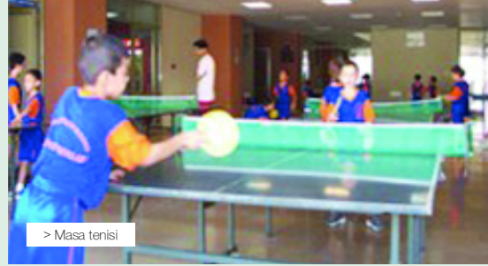
> Masa tenisi