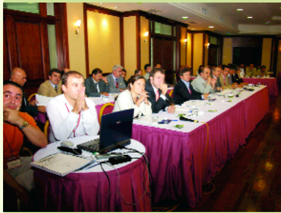
>Turizm platformu toplantısından görüntüler.