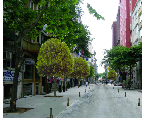
> Talimhane Bölgesi Fiziksel Düzenleme ve Yayalaştırma Projesi

ne Bölgesi Fiziksel Düzenleme ve Yayalaştırma Projesi'dir. Büyük organizasyonlar ve destekleyici kentsel projeler, kentlerin geleceğini olumlu yönde değiştirmektedir. Organizasyonlara yönelik düzenlemelerin önceliği elbetteki iyi bir evsahipliği sunmak ve organizasyondan hem kısa vadede hem de uzun vadede sosyal ve ekonomik kazançlar elde etmektir. Buradan hareketle, Talimhane Bölgesi'nde yürütülen çalışmalar uluslararası büyük organizasyonlarda kentin yeteneklerin başarıyla sergilenmesi, hem de uzun vadede bölgenin kalkınması ve dönüşmesi için tetikleyici unsur olarak titizlikle geliştirilmesini amaç edinmektedir.