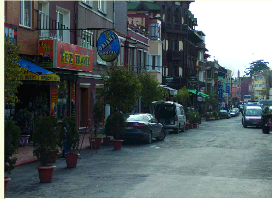
>Sultanahmet Bölgesi Akbıyık Caddesi Kentsel Tasarım Proje Alanının Genel Görünümü

lanması için yapılmış olan bu düzenlemeler, uzun vadede kentimizin geleceği için geliştirilecek ve sürdürülecektir.